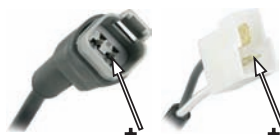
Deutsch DT 2-pin cap